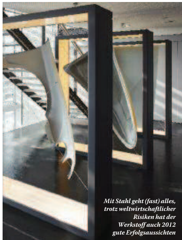
Mit Stahl geht (fast) alles, trotz weltwirtschaftlicher Risiken hat der Werkstoff auch 2012 gute Erfolgsaussichten

Schädlich: Jede Prognose ist mit Unsicherheiten verbunden. Die Risiken rund um den Globus haben deutlich zugenommen – nennen möchte ich hier gewachsenen Staatsschulden, instabile Finanzmärkte, steigende Inflationserwartungen und sich verschlechternde Finanzierungsbedingungen. Risiken liegen zudem in der sich abschwächenden konjunkturellen Entwicklung in Südeuropa und in den asiatischen Exportmärkten. Dennoch: Unsere Kundenbranchen sind überwiegend optimistisch. Wir erwarten, dass die Konjunktur stabil bleibt und sich die Produktion auf hohem Niveau beruhigt. In 2012 könnte aus heutiger Sicht ein Wachstum von bis zu vier